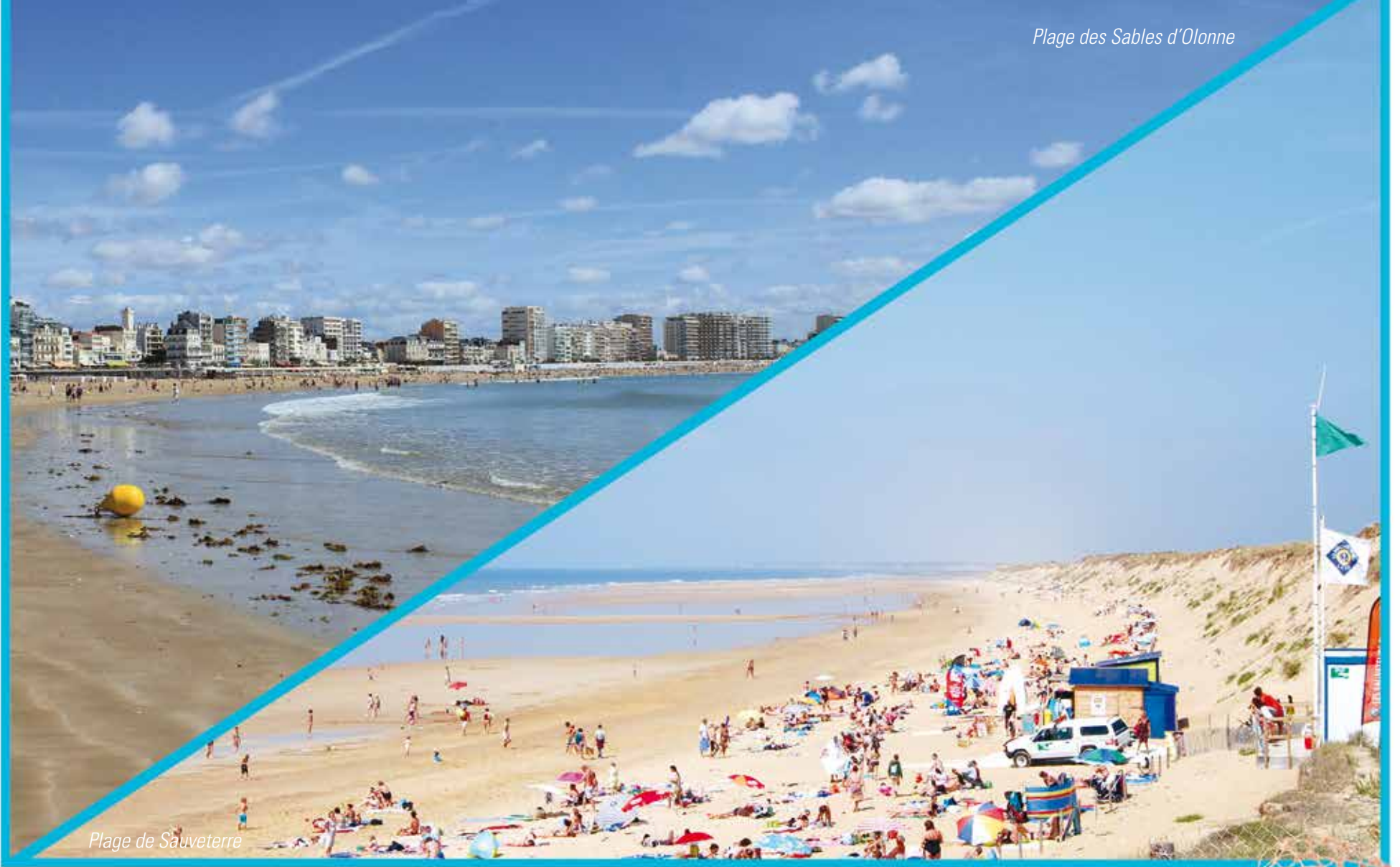
Plage de Sauveterre