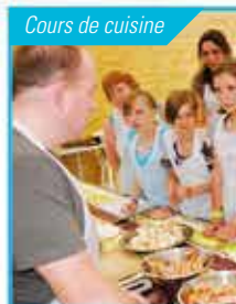
Cours de cuisine