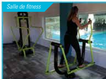
Salle de fitness